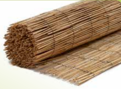
06 RIETMAT TONKIN

Afmetingen: 60 x 600 cm, 80 x 600 cm, 100 x 600 cm, 120 x 600 cm, 140 x 600 cm, 160 x 600cm, 180 x 600 cm, 200 x 600 cm