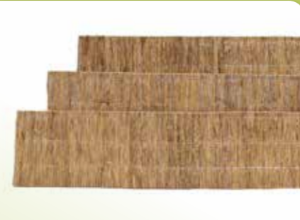
03 RIETPLAAT NAGY 03

Afmetingen: 100 x 200 cm, 150 x 500 cm, 180 x 500 cm, 200 x 500 cm