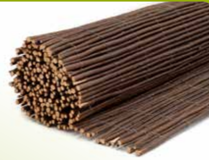
7/8 WILGENMAT CONCOUR

Wilgenmat Concour gemaakt van circa 10 mm dikke wilgentenen per stengel samengebonden met een gegalvaniseerde ijzeren draad. In verschillende hoogtes leverbaar en in lengtes van 200cm en 300cm .