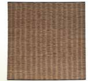
21 WILGENSCHERM AVANTGARDE

Scherf van gevlochten wilgentenen op een stalen zwart gecoat frame. De wilgentakken zijn verduurzaamd met een speciale natuurvriendelijke stoombehandeling doordat ze zijn geschild heeft het zijn specifieke kleur. Het scherm brengt veel privacy en is makkelijk te monteren in een tuin of op een balkon. In meerdere maten leverbaar.