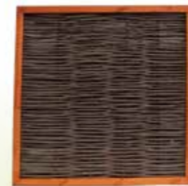
24 WILGENSCHERM DURABLE

Afmetingen: 90 x 180 cm, 120 x 180 cm, 180 x 180 cm