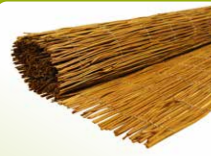
09 BLACK FERN FENCE

Afmetingen: 50 x 300 cm, 50 x 200 cm, 75 x 300 cm, 75 x 200 cm, 100 x 300 cm, 100 x 200 cm, 125 x 300 cm, 125 x 200 cm, 150 x 300 cm, 150 x 200 cm, 175 x 300 cm, 175 x 200 cm, 200 x 300 cm, 200 x 200 cm