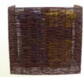
22/23 CONTAINER OMBOUW 22/23

Wilgen container ombouw gemaakt van gevlochten wilgentenen om een zwart ijzeren frame. Beschikbaar voor een enkele of dubbele container.