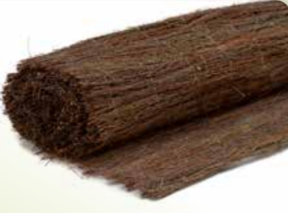
11 DOPHEIDEMAT CLASSIC

Afmetingen: 100 x 300 cm, 150 x 300 cm, 175 x 300 cm, 200 x 300 cm