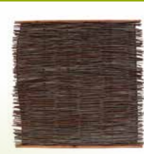
18 WILGENSCHERM ELEGANCE

Afmetingen: 100 x 300 cm, 150 x 300 cm, 175 x 300 cm, 200 x 300 cm