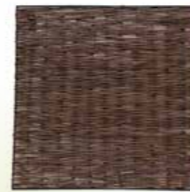
19 WILGENSCHERM STINGRAY

Afmetingen: 90 x 180 cm, 120 x 180 cm, 180 x 180 cm