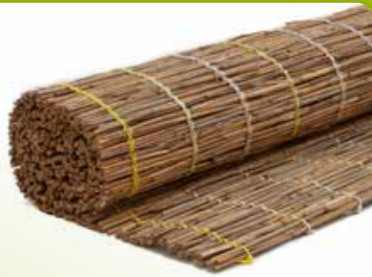
02 RIETMAT TISZA

Afmetingen: 50 x 200 cm, 75 x 200 cm, 100 x 200 cm, 125 x 200 cm, 150 x 200 cm, 175 x 200cm, 200 x 200 cm