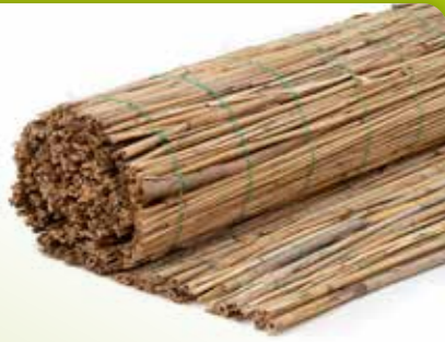
01 RIETMAT PUSZTA

Rietmat gemaakt van circa 15 mm dikke zoetwater rietstengels en deze zijn met meerdere stengels met een groen perlon draad gebonden. De standaard lengte is 200 cm en in verschillende hoogtes leverbaar.