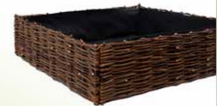
52 WILGEN KREEKBK 52

Afmetingen: Enkel 64 x 80 x 115 cm, Dubbel 80 x 115 x 121 cm