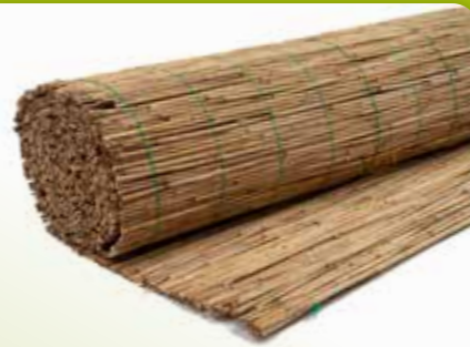
04 RIETMAT DONAU

Afmetingen: 50 x 200 cm, 75 x 200 cm, 100 x 200 cm, 125 x 200 cm, 150 x 200 cm, 175 x 200cm, 200 x 200 cm