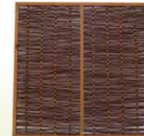
20 WILGENSCHERM IN FRAME

Afmetingen: 90 x 180 cm, 120 x 180 cm, 180 x 180 cm