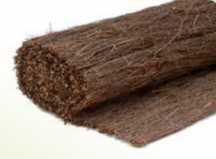
12 DOPHEIDEMAT ELEGANCE

Afmetingen: 100 x 500 cm, 150 x 500 cm, 175 x 500 cm, 200 x 500 cm