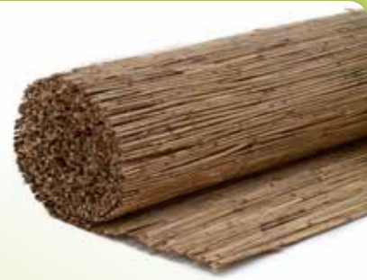
05 RIETMAT FERTO

Afmetingen: 60 x 600 cm, 80 x 600 cm, 100 x 600 cm, 120 x 600 cm, 140 x 600 cm, 160 x 600cm, 180 x 600 cm, 200 x 600 cm